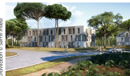
Gravitation © Semfi Invest