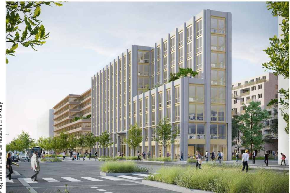
Programme L'Éveil de Flaubert

Positioned beside the T4 bus lane, the offices are bordered by gardens at the centre of the complex and have shops and services on the ground floor: eateries and dining options, a nursery etc. The B1 building has space for purchase and the B2 building has space for lease.