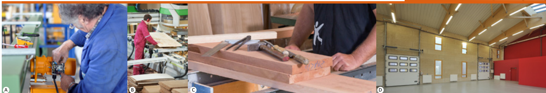
A - B ©Fotlia, C - D © RNI

Rouen Normandy Invest Sylvie FLEURY Tél. : 02 32 81 84 87 s.fleury@roueninvest.com