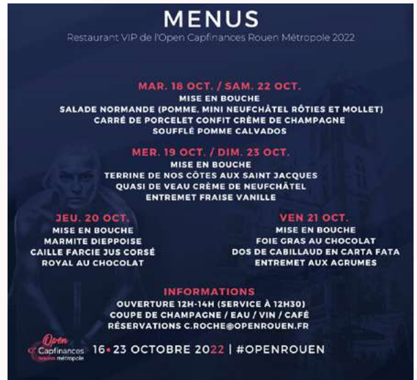
Menu restaurant de l'Open 2022

(tarif préférentiel pour les partenaires)