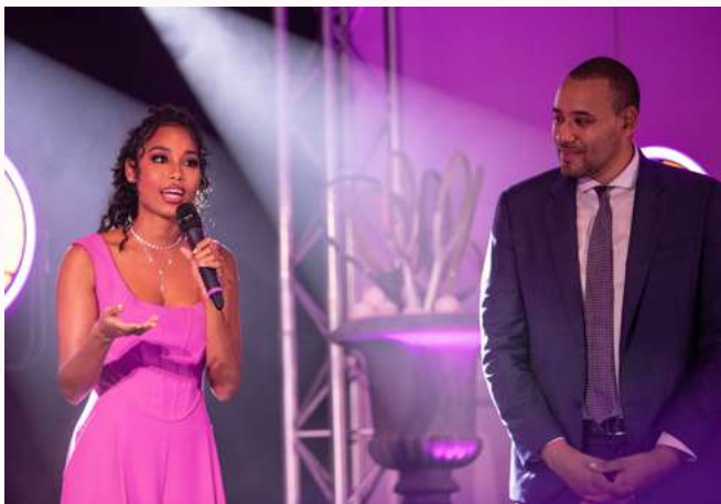
Clémence Botino (Miss France 2020) Diner de gala 2022