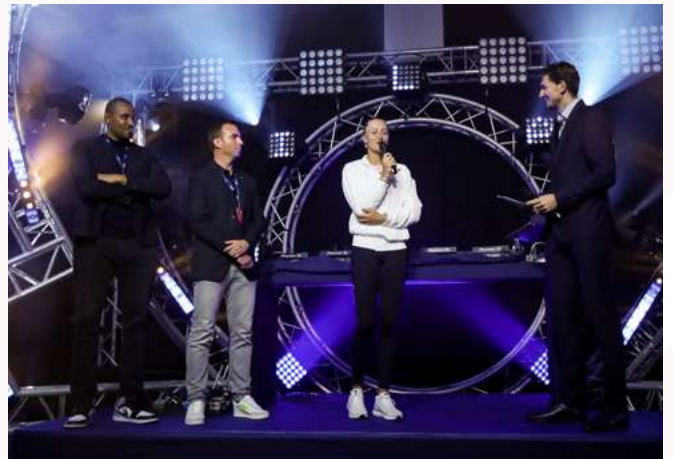
Kristina Mladenovic Players Party 2022