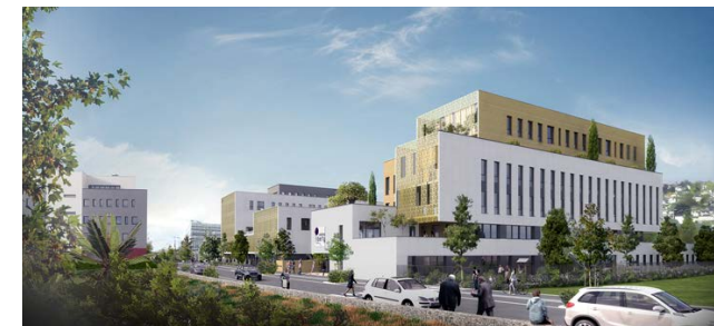
Odyssée - Centre de dialyse, crèche et bureaux