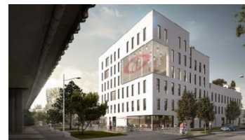
ADIM - Pôle de services et bureaux