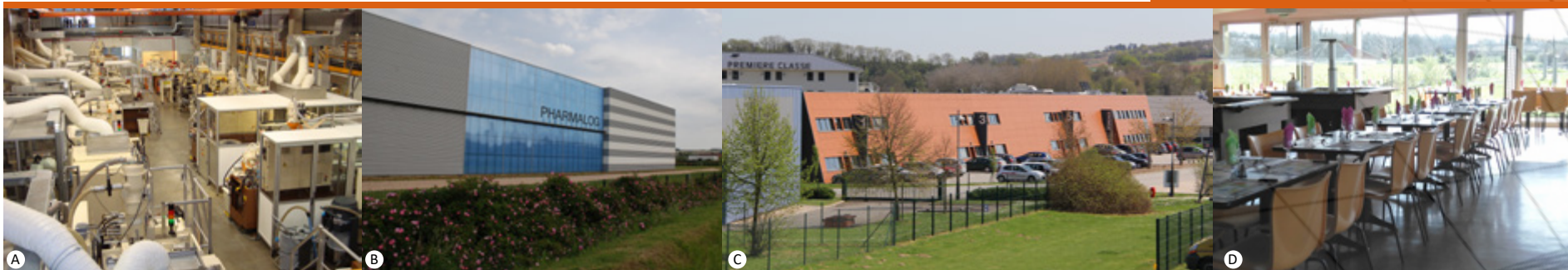
A - ©Aptar, B - Pharmalog ©Agglomération Seine Eure, C - Hôtel d'entreprises ©Agglomération Seine Eure, D - Aire de services ©RNI

Promotion / Commercialisation Communauté d'Agglomération Seine-Eure Service Commercialisation et Implantation Tél. : 02 32 40 79 50 imc@seine-eure.com