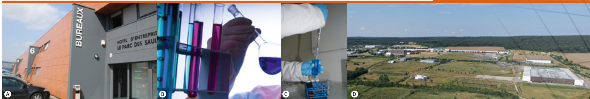
A- Hôtel d'entreprises Le Parc des Saules ©Agglomération Seine Eure, B - ©Fotolia, C - ©Agglomération Seine-Eure, D - PharmaParc II ©Altivulus

Promotion / Commercialisation Communauté d'Agglomération Seine-Eure Service Commercialisation et Implantation Tél. : 02 32 40 79 50 imc@seine-eure.com