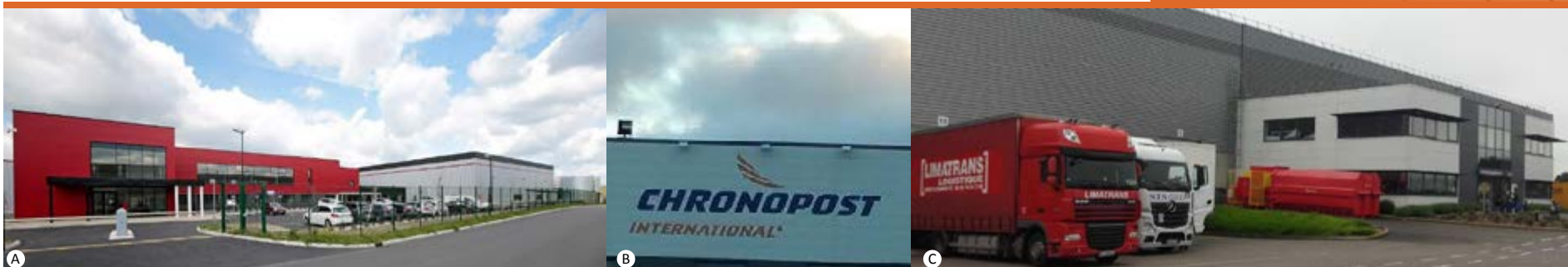
A - Groupe Cofel, B - Chronopost, C - Kuehne et Nagel

5 hectares restent mobilisables pour accompagner le développement futur de cet ensemble.