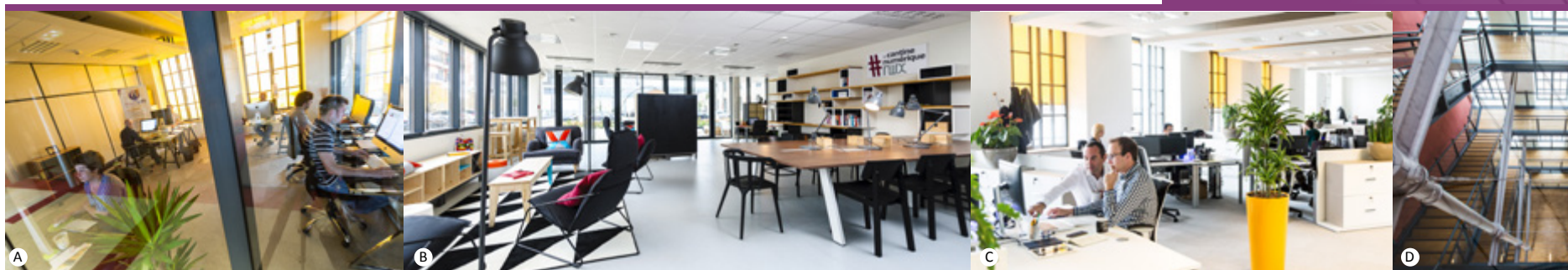
A - Bureaux Seine Innopolis ©Martin Flaux, B - Cantine Numérique #NWX ©Nicolas Broquedi, C - Startup Orone ©Martin Flaux, D - ©Martin Flaux