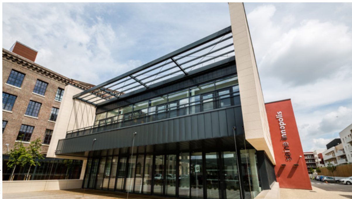
Seine Innopolis

▶ 2016 Confirmation de la Labellisation Normandy Frenchtech