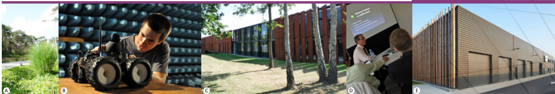
A - Technopôle du Madrillet ©RNI, B - @Esigelec, C- CISE ©RNI, D - Pépinière - Hôtel d'entreprises Innovapôle 76 ©CCI de Rouen, E - Les Ateliers du Madrillet © Guillaume JOUET