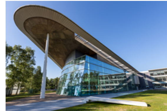
INSA de Rouen