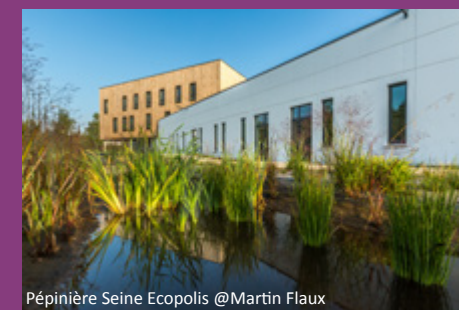
Pépinière Seine Ecolpolis